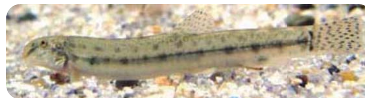
じっさいの大きさ